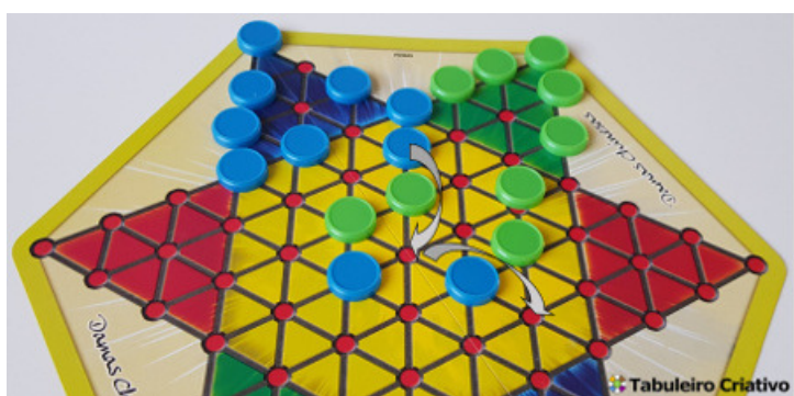
A peça azul pode mover saltando duas vezes!

2) Saltando sobre uma peça. É permitido saltar sobre qualquer peça (suas ou dos seus oponentes), desde que haja uma casa livre após a peça que está sendo pulada (não é permitido saltar sobre duas ou mais peças). Se for possível, é permitido saltar múltiplas vezes em uma mesma jogada (desde